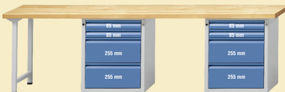
Modell 909 E