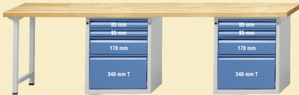
Modell 904 E

Farbabweichungen sind drucktechnisch bedingt.