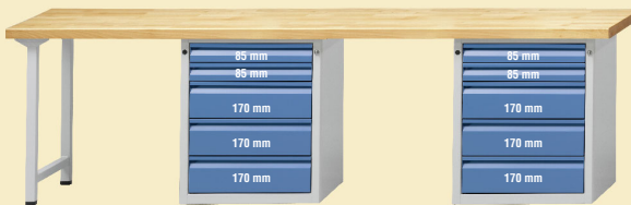
Modell 906 E