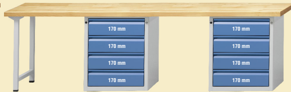
Modell 905 E