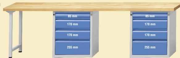
Modell 907 E