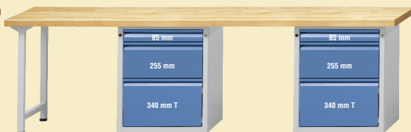
Modell 910 E