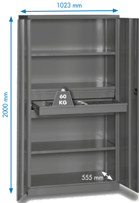
WP 6000 C