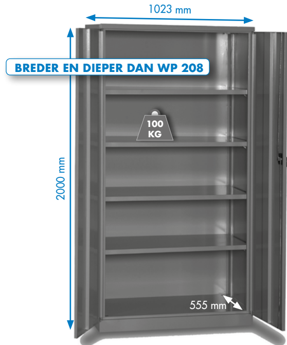
WP 6000 A