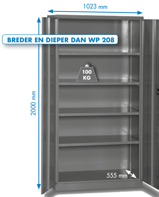
WP 6000 A