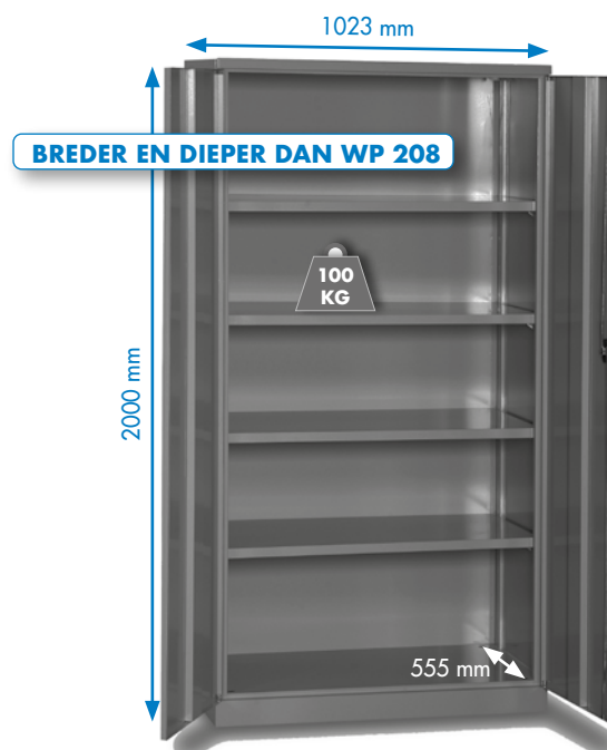
WP 6000 A