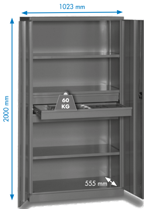
WP 6000 C